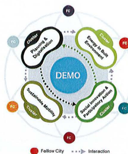
Figura 2: WeGenerate Innovation Hub cu 4 clustere de soluții

Cele două clustere tehnologice care se concentrează pe energie, mediul construit și mobilitatea sustenabilă vor co-crea soluții noi cu Demo-urile, care sunt nu numai fezabile din punct de vedere tehnologic, ci și dezirabile din punct de vedere social. Având în vedere relevanța comunităților de energie regenerabilă/cetățenilor în Demo-uri, Clusterul de soluție „Energie în mediul construit” va investiga în special tehnologiile generice pentru comunitățile energetice care promovează eficiența energetică, producția, distribuția și furnizarea de energie, consum, stocare și schimb. Un portofoliu de tehnologii a fost identificat pentru a accelera comunitățile energetice: active energetice (de exemplu, panouri solare fotovoltaice, pompe de căldură și baterii), componente de monitorizare (de exemplu, contoare inteligente și senzori) și sisteme de management (de exemplu, sisteme de gestionare a energiei, platforme inter pares și seturi de instrumente de răspuns la cerere) [23]. Aplicarea lor potențială va fi explorată împreună cu Demo-urile.