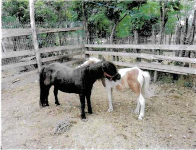
O pereche de măgăruși – animale afectuoase și liniștite, care cuceresc prin firea lor calmă și aspectul adorabil. Se înțeleg de minune cu restul animalelor.