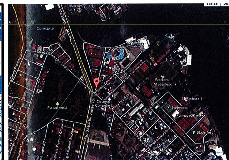
MUNICIPIUL BUCURESTI PRIMĂRIA SECTORULUI 2